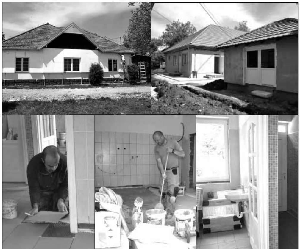
A Gyulai úti általános iskola tállókönyhájának és ebédlőjének teljes felújítása és bővítése

egy új, közösségi térként funkcionáló, modern és szabványos játszótér kerül kialakításra. Természetesen tovább folytatódik a városi piac fejlesztése, a tavaszra már elkészült, impozáns új csarnok mellé egy új, kétszintes kiszolgáló épület épül irodákkal, hűtőházzal és új mellékhelyiségekkel, valamint új parkoló is létesül elektromos gépkocsi töltővel, de megújulnak az elárúsító asztalok is. Hamarosan kezdődik a Városgazdálkodási Iroda Sarkadkeresztúri úti telephelyének a fejlesztése is, ahol egy új ipari csarnok és iroda-szociális épületépítés, de megújul a településhálózat és a parkolók is. Az óvodák további fejlesztése kerekében sor kerül a Kossuth utcai óvoda energetikai korszerűsítésére, valamint egy újabb, jelentős közlekedésfejlesztési beruházással is gazdagodik a város, mert új aszfaltburkolatot kap a Zsarói utca.