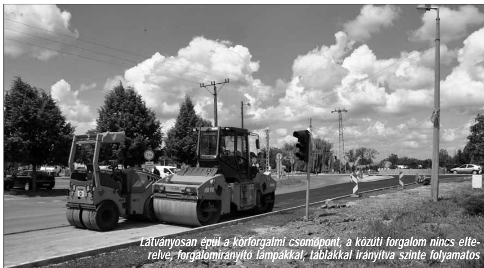
Látványosan épül a körforgalmi csomópont, a közúti forgalom nincs elterelve, forgalomirányító lámpákkal, táblákkal irányítva szinte folyamatos

Szintén tavasszal kezdődött és jól halad a Gyulai úti általános iskola tálalókonyhájának és ebédlőjének teljes felújítása és bővítése. A projekt keretében a tálalókonyha és étterem épületének átalakítása és egy új épületrésszel való bővítése zajlik mintegy 90 millió forintból. Az étterem a meglévő épületrészben kap majd helyet, míg a melegítő-tálaló konyha helyiségei, valamint a szociális és kiegészítő helyiségek az új bővítményben kerülnek kialakításra. Az átalakítást és bővítést követően kialakuló épület hasznos