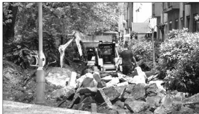
A Béke sétány felújítása során közel egymillió darab burkoló követ tesznek majd le a kivitelező dolgozói

21 m 2 . Áprilisban látott hozzá a kivitelező városunk egyetlen sétáló utca jellegű közterületének, a leromlott állagú, önkormányzati tulajdonú Béke sétány, mint meglévő közösségi tér felújításának és funkcióbővítésének. A fejlesztés során a Béke sétány jelenlegi egyenes nyomvonalát a templom melletti első épülettömb környezetében módosul, míg a gyógyszerártnál és az orvosi rendelőnél található csomópontokban terek kerülnek kialakításra. (folytatás a 2. oldalon)