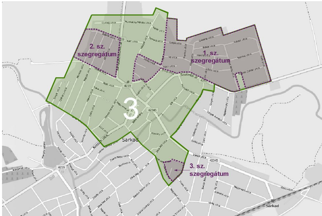
3. számú ábra: A szegregátumokat átölelő akcióterület az Integrált Településfejlesztési Stratégia alapján