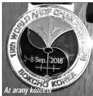
Az arany közelről

Az első rókadás versenyem itt Sarkadon volt, pontosabban Sarkad és Sarkadkeresztúr között 1967-ben. Nem tudom azóta mennyi versenyen voltam és mennyit nyertem meg, de itt ezekben a fiókokban tartom az okleveleket, érmeiket.