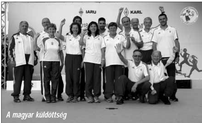
A magyar küldöttség