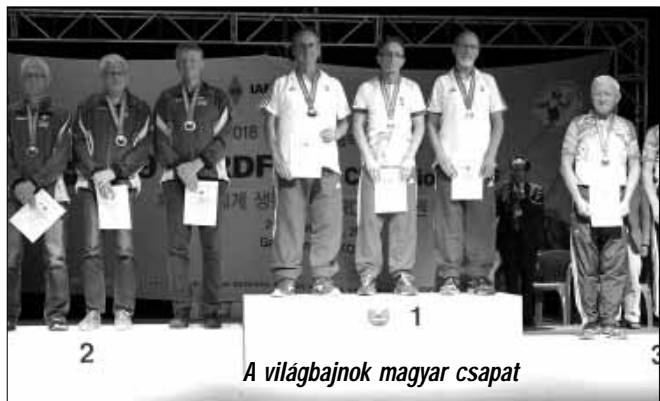
A világbajnok magyar csapat