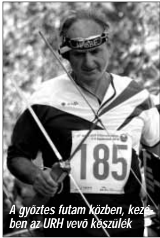
A győztes futam közben, kezében az URH vevő készülék